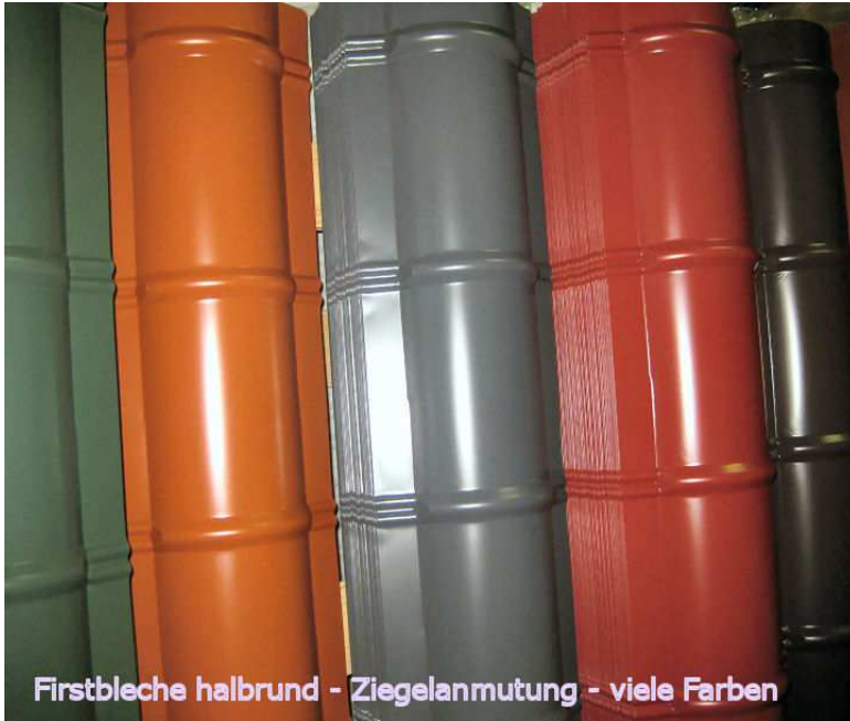
Firstbleche halbrund - Ziegelanmutung - viele Farben

Länge Firstprofile für Pfannenblech 1.860mm – Nutzlänge 1.720mm – seitliche Schraub- Laschen je 35mm – Abschlußendstücke zum Abdecken der seitlichen Halbrundöffnungen