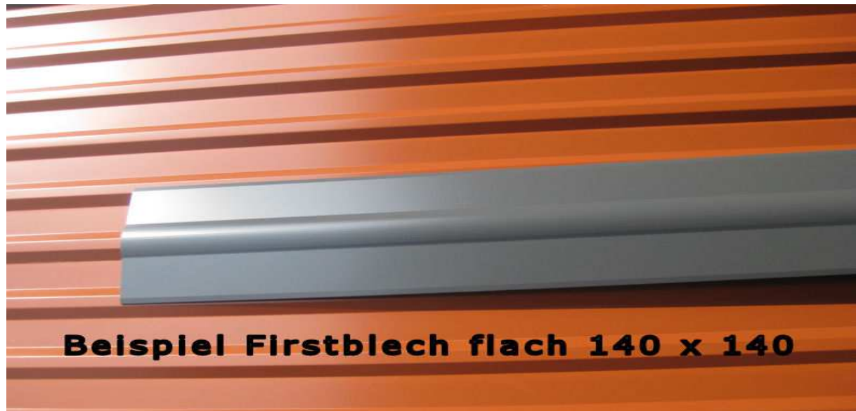
Beispiel Firstblech flach 140 x 140